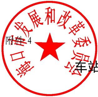
车站、码头、交通枢纽站等停车设施新能源汽车车辆停放服务费收费标准表