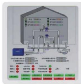
膜分离氮气调工艺控制示意图

膜分离氮气横向循环气调工艺，调节粮食储藏环境中氮气、氧气等气体成分的比例，使粮堆内氮气浓度快速上升至 95% ~ 98%，氧气浓度下降为 2% ~ 5%，并维持一段时间，可高效抑制储粮害虫生长繁殖，降低粮食呼吸代谢速率，减少粮食储藏损耗。膜分离氮气循环气调绿色储粮技术属于低氧害虫防治技术，对于抗药性强的储粮害虫的杀虫效果显著，可大幅度减少储粮化学药剂和防护剂的使用，降低化学药剂对环境和粮食的污染，实现绿色储粮。