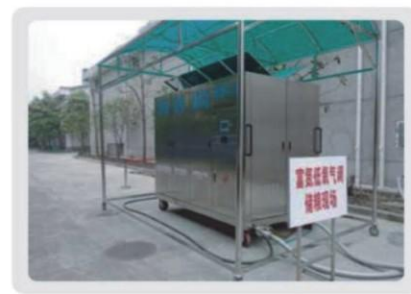
膜分离氮气循环气调储粮现场图