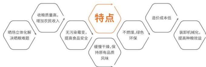
该成果是科技创新, 助力种粮现代化的实施。

将收获后高水分粮食（农产品）直接装载于旋转通风干燥储存仓，采用钢网仓体旋转翻动和辅助通风相结合的干燥工艺，对粮食进行干燥处理，干燥后也可就仓短期安全储存。可同时配备虫霉防治技术，粮情在线监测和自动控制系统，以及辅助加热通风干燥技术或辅助除湿干燥技术，达到新收获高水分粮食全程不落地收储，低能耗保质干燥处理和安全短期储存的目的。