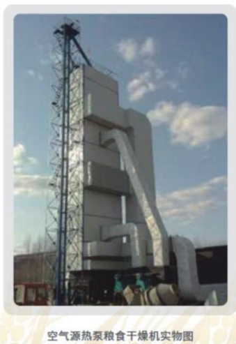
空气源热泵粮食干燥机实物图