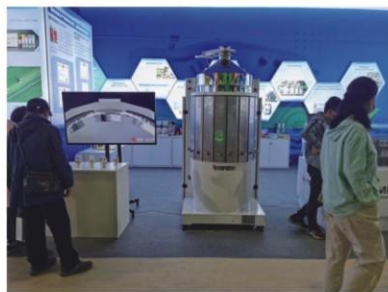
入选“国家‘十三五’科技创新成就展”

核心成果柔性碾米机，采用柔性砂带替代已一个半世纪的刚性碾米砂辊或铁辊，大米出品率可提升 5~8 个百分点以上。与传统碾米机相比，加工粳米时碎米率下降 6 个百分点以上(粳米碎米率下降 3 个百分点以上)，吨米电耗下降 10kWh，糙米加工成白米时米粒温度上升幅度下降 15℃以上，调整参数还可生产留胚米。技术评价结论“达到国际领先水平”。