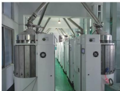
大米车间应用现场之一